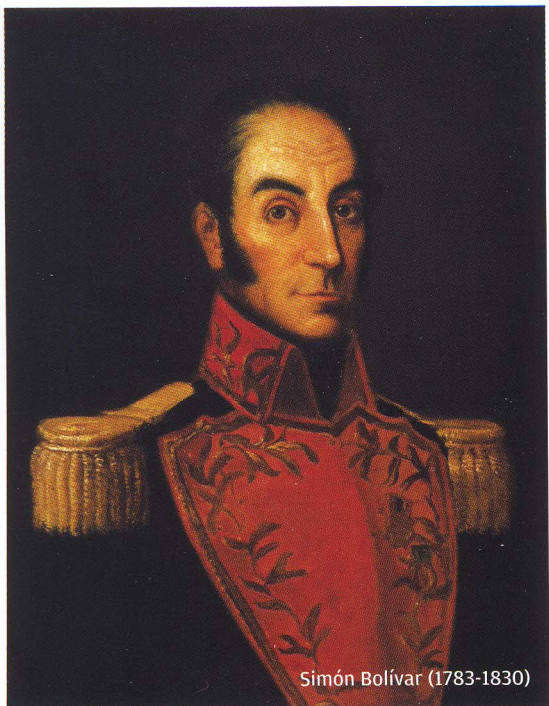
Simón Bolívar (1783-1830)